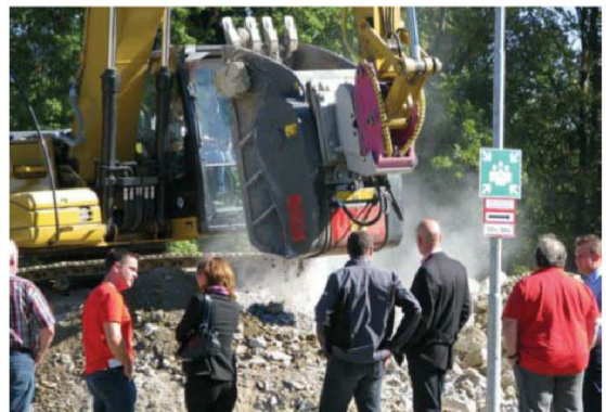
Neben Vorträgen und Betriebsbesichtigungen gab es am 2. Winkelbauer-Hardox-Tag auch zahlreiche Maschinendemonstrationen zum diesjährigen Motto: „Verschleißschutz, Abbruchgeräte & Recycling“